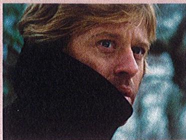
Nom de code : Condor (Robert Redford).

En 1975, deux ans après le scandale du Watergate, SYDNEY POLLACK s'en prenait au côté obscur des institutions américaines, sous la forme d'un thriller magistral et haletant. Inspiré d'un roman de James Grady, LES TROIS JOURS DU CONDOR s'inscrit dans la veine politique contestataire du Nouvel Hollywood des années 1970, après Conversation secrète , de Francis Ford Coppola, ou À cause d'un assassinat , d'Alan J. Pakula, sortis l'année précédente. Un rond-de-cuir de la CIA (le charismatique Robert Redford, qui tournera sept fois, en tout, avec Pollack) y débusque un complot au sein même de l'Agence, un réseau dans le réseau. Traqué, seul au monde (à l'exception, éblouissante, de Faye Dunaway, en photographe qu'il entraîne dans sa fuite), le héros se bat pour faire éclater la vérité. Dénonçant à la fois l'ingérence de la CIA dans le monde entier et la compromission des appareils d'État, ce chef-d'œuvre de tension et d'efficacité bénéficie